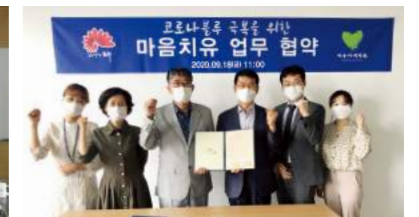
전주시청 마음치유 협약(9월)