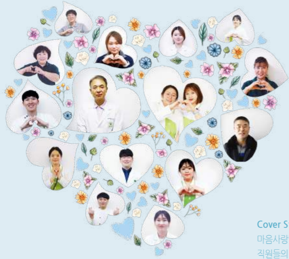
Cover Story_ 마음사랑병원 '스마일캠페인' 마음사랑병원을 이용하시는 여러분께 드리는 직원들의 친절, 사랑 그리고 새 희망의 미소입니다.