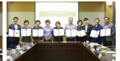
*정신건강토달케어 네트워크 협약

*정신건강토달케어 네트워크 협약 (6월) (익산자살예방연대(익산시), 원광심리치유센터(익산시), 애가원(남원시), 마음꽃복지센터(완주군), 장수사랑 해밀(장수군), 사회복지서비스 행복한 세상(순창군), 공감심리상담센터(무주군))