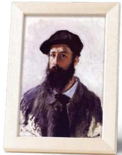
클로드 모네 Claude Monet

1865년에는 작가와 모델로 만난 카미유와 사랑에 빠지게 되었고, 아들을 출산했습니다. 그동안 부모와 친척이 보내오는 자금으로 돈 걱정 없이 작품 활동을 할 수 있었지만, 부모의 허락 없이 카미유와 결혼한 모네에게 그의 부모는 금전적 지원을 끊어버렸습니다. 가난한 삶을 살았던 부부였지만 아들과 함께 행복한 한때를 보냈고, 그 순간을 보여주는 작품이 바로 『양산을 든 여인』입니다. 하지만 카미유는 골반에 생긴 종양으로 32세의 이른 나이에 세상을 떠났습니다. 비록 모네는 이후에 재혼하였지만 카미유를 향한 그리움을 평생 가슴속에 간직했다고 합니다. '빛은 곧 색채'라는 인상주의 원칙을 고수하며 인상파의 창시자로 평가 받는 그는, 《수련》, 《인상, 일출》과 같은 걸작을 남기는 등 후대의 많은 화가에게 큰 영향을 미쳤습니다. 말년에는 백내장으로 시력을 거의 잃게 되지만, 작품에 대한 열정으로 그림 그리기를 끝까지 멈추지 않습니다. 1926년, 86세로 지베르니에서 생을 마감했습니다.