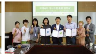
학산중합사회복지관 & 평화사회복지관 협약(8월)